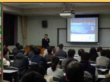
12/15 デッラ-労組春取り研修会