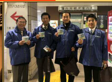
11/29 三河中地協街頭活動