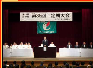
10/14 アイシン機工労組定期大会