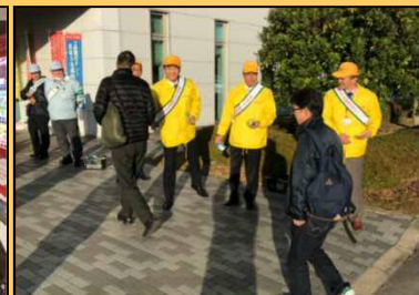
12/1 デッラ-善明製作所役員立哨