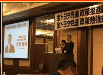
11/6 全トヨタ労連政策推進部 全トヨタ労連政策勉強会