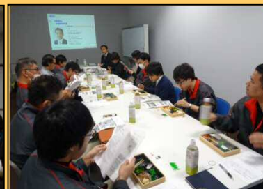
12/20 アイソAW労組地域生活懇談会