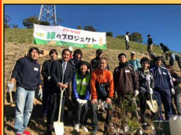
12/2 デッラ-緑のプロジェクト in 善明