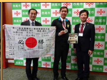
12/11 アリリッパの銀メダル獲得報告