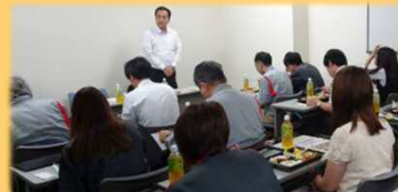
6/20 アイシンAW労組地域懇