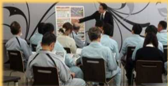
4/16 デンソー労組ふれあい懇談会