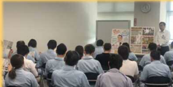
5/25 デンソー労組ふれあい懇談会