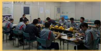
5/11 アイシンAW労組地域懇