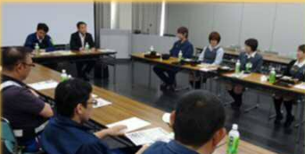
5/24 アイシン高丘労組地域懇