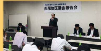
6/8 三河中地協西尾地区議会報告会