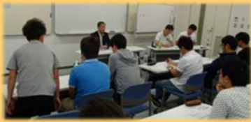
5/19 トヨタ労組生活総点検研修