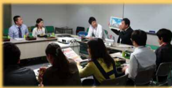
4/19 アイシンAW労組地域懇