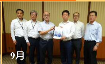
9月 農林農村整備事業の促進要望書提出