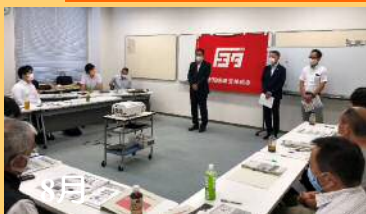
トヨタ労組 職場役員研修会