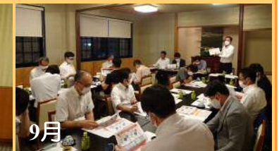
9月 三河中地協 議会報告会