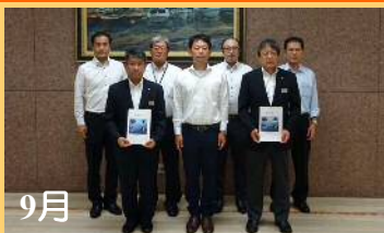
9月 建設事業の促進要望書提出