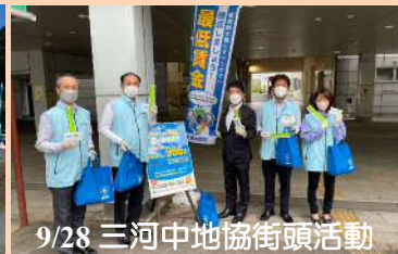
9/28 三河中地協街頭活動