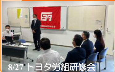
8/27 トヨタ労組研修会