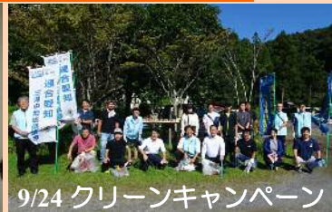
9/24 クリーンキャンペーン