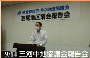
9/14 三河中地協議会報告会