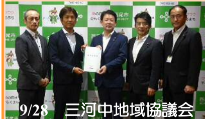
9/28 三河中地域協議会