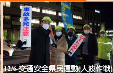
12/6 交通安全県民運動(人波作戦)