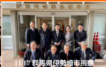
11/17 群馬県伊勢崎市視察