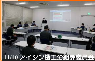
11/10 アイシン機工労組評議員会