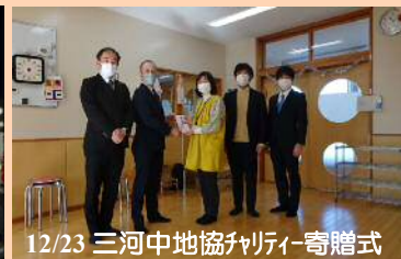
12/23 三河中地協チャリティー寄贈式