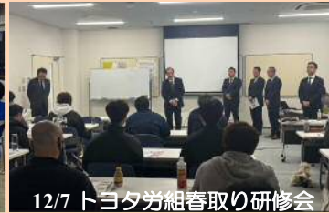
12/7 トヨタ労組春取り研修会