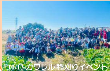
10/13 カワレル 稲刈りイベント