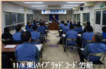
11/8 東ハイブリッドコード 労組